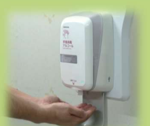
⑤ 手指衛生を行う (手+肘まで行う)