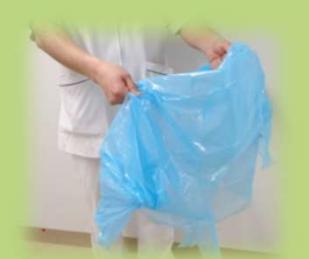
④ 腰紐を引きちぎり、適当な大きさにまとめ、静かに廃棄する