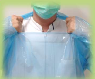
① 肩口を持ち首紐をちぎる