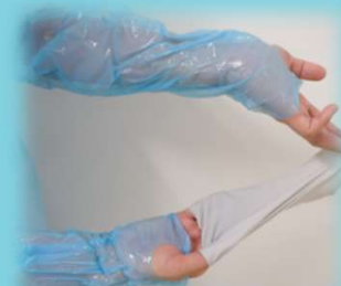
④ フック穴から親指を外す