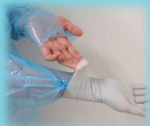
③ 袖口から中に指先を差し込み②と同様に外す