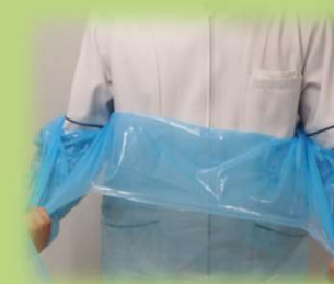
② 汚染面が内側になるよう腰のあたりで折りたたむ