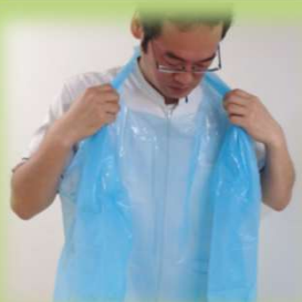
① ガウンを首にかける