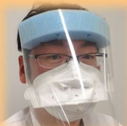
③ 広範囲フェイスシールドまたはサージカルマスク +アイガードを装着する