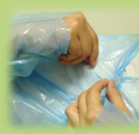
⑤ 首回りが大きく開く場合は テープで調整する