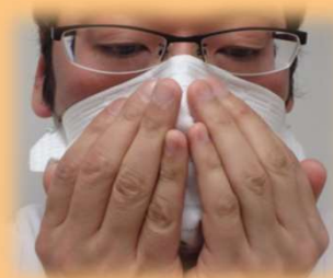
② 漏れがないかシール チェックで確認する