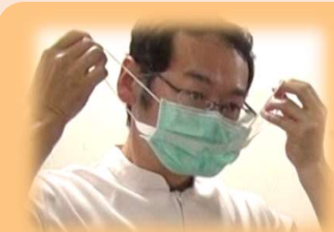
① ゴム紐を持ち、アイガード+マスクを一緒に外す