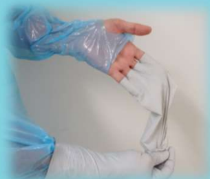
② 外側が内側になるように外す