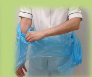
③ 清潔な内側を触り袖から両腕を抜く