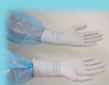
③ ガウンの袖口の上に手袋を被 せる(肌が見えないようにする)