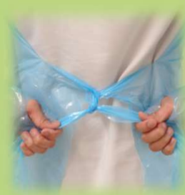
④ 解けないように 腰紐を後ろで結ぶ