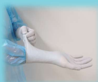
② 反対の手も①と同様に 手袋を着用する