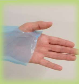
③ 親指を親指フック 穴に通す