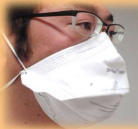
① N95マスクを正しく 装着する