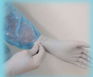
① 手袋の外側をつまむ