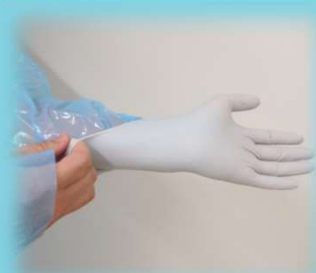
① 手袋の手首の部分をつか んではめる