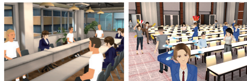
※画面はイメージです

お手持ちのパソコンやスマートフォン、タブレットからお好きなアバターを選んで簡単に体験いただけます。特設会場で交流したり、コンテンツをご覧いただいたりするコーナーもご用意しています。お楽しみに!